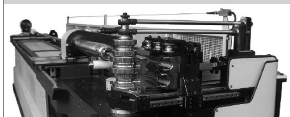
PROVAR 6 U-D